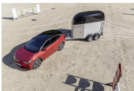
La Volkswagen ID.4 GTX è un SUV 100% elettrico a trazione integrale capace di trainare fino a 1.400 kg

Verona – Dopo l'edizione digitale del 2020 dovuta alla pandemia da coronavirus, quest'anno torna in presenza Fieracavalli, l'evento internazionale dedicato al mondo equestre legato alla Volkswagen da una partnership di lungo corso. Anche per questa edizione, la numero 123, la Marca è infatti Main Sponsor del Gran Premio 123x123 di salto a ostacoli e Main Partner dell'unica tappa italiana della Longines FEI World Cup™. Il prestigioso salone, riferimento nel panorama equestre italiano ed europeo che si svolge a Verona dal 1898, quest'anno si terrà da giovedì 4 a domenica 7 e da venerdì 12 a domenica 14 novembre a Veronafiere. I visitatori avranno l'occasione di scoprire il SUV 100% elettrico a trazione integrale bimotores ID.4 GTX, capace di trainare rimorchi con peso fino a 1.400 kg. Esposti anche il bestseller Tiguan e la Touareg, l'ammiraglia SUV della Volkswagen. Comune a questi due modelli, tra gli altri, è la possibilità di essere dotati di Trailer Assist, l'assistente alle manovre con rimorchio ideale anche per chi deve trasportare cavalli.